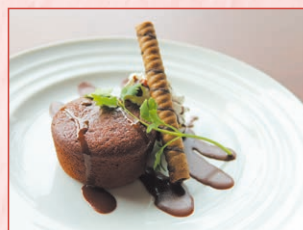
フォンダンショコラ Chocolate cake 550円 (税込)