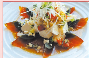
皮蛋豆腐(ピータン豆腐) Century egg tofu 880円 (税込)