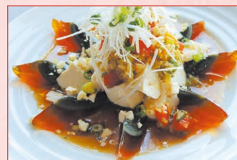
皮蛋豆腐(ピータン豆腐) Century egg tofu 880円 (税込)