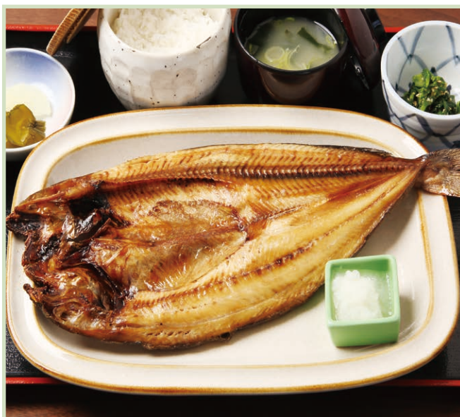
ほっけ定食 Atka mackerel set meal 1,650円(税込)