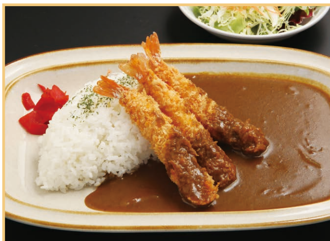
海老フライカレー(サラダ付) Fried shrimp curry (with salad)