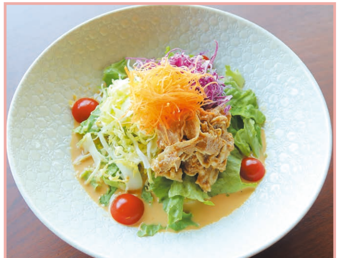
ラーメンサラダ(ゴマだれ) Ramen noodle salad (Sesame sauce) 1,100円(税込)