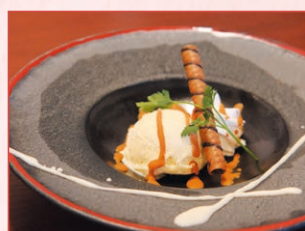
アイスクリーム Ice cream 440円 (税込)