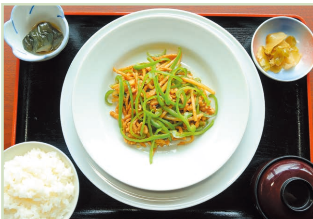
青椒肉絲定食 Stir-fried beef and green pepper set meal 1,540円(税込)