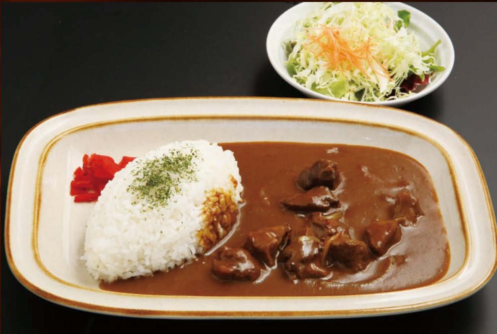
白老牛 ビーフカレー (サラダ付き) Shiraoi beef curry (with salad)

Menu of Wagyu beef, a brand representative of Hokkaido