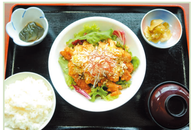
油淋鶏定食 Chinese-style fried chicken set meal 1,540円(税込)

メイン料理にごはん・味噌汁・小鉢・香の物が付きます。 For main dish Rice, miso soup, small side dish, pickles It will arrive.