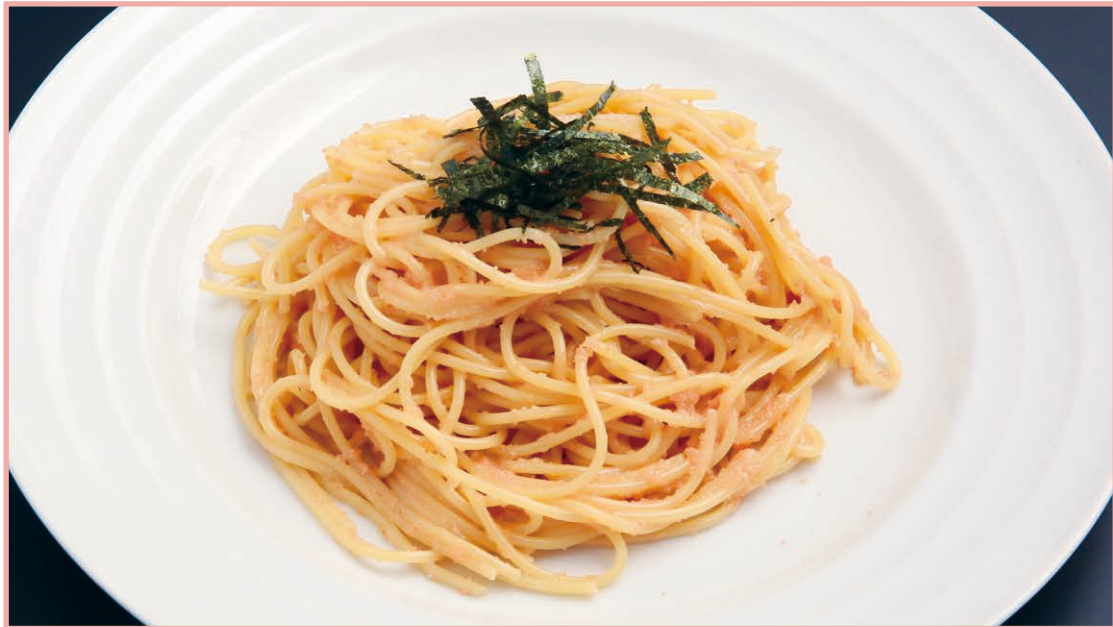
虎杖浜産たらこパスタ Tarako pasta from Kojohama 990円(税込) (+150円でミニサラダを追加することができます)