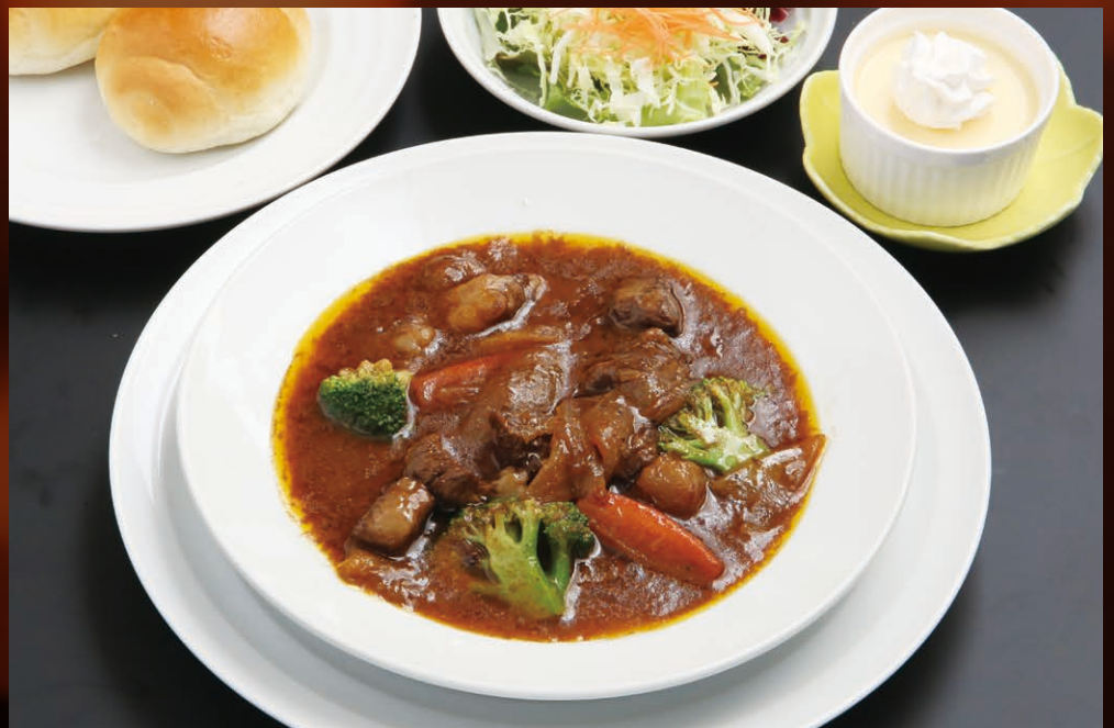
白老牛 ビーフシチュー (ライスまたはパン) Shiraoi beef stew (Rice or Bread)