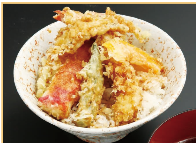
天丼(味噌汁、香の物付) Tempura rice bowl with sweet soy sauce (with miso soup and pickles)