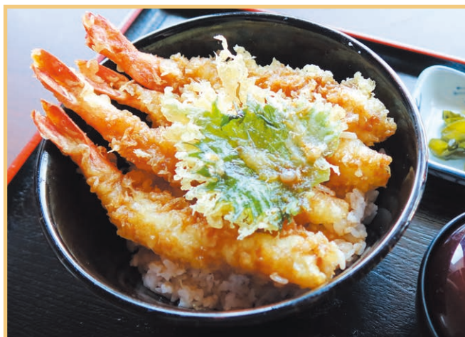
大海老天丼(味噌汁、香の物付) Large shrimp tempura rice bowl (with miso soup and pickles)