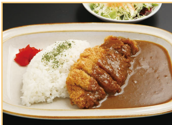
カツカレー(サラダ付) Pork deep fried curry (with salad)