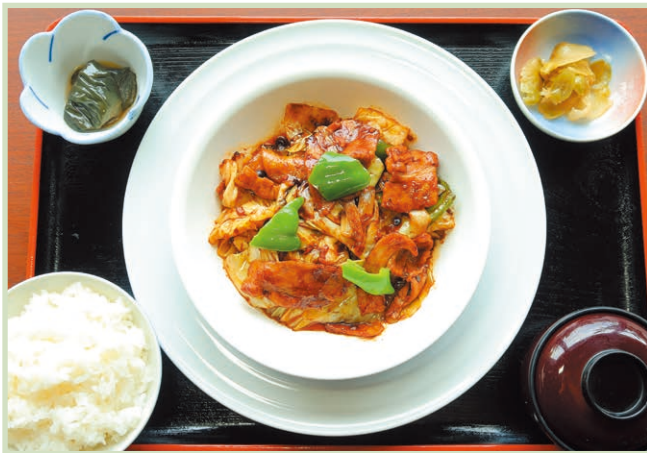
回鍋肉定食 Twice-cooked pork set meal 1,540円(税込)