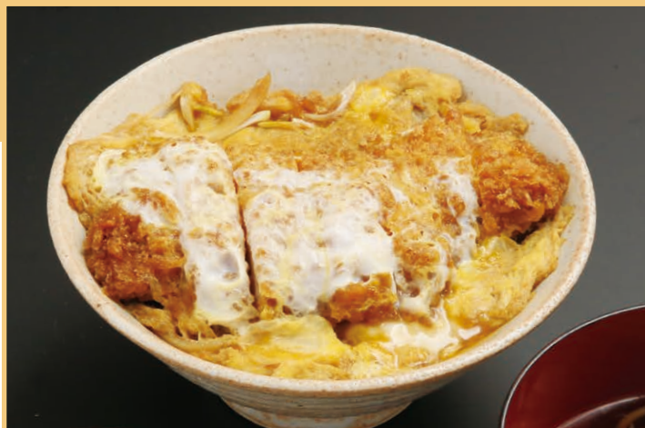
北海道産豚ロースかつ丼(味噌汁、香の物付) breaded pork on rice (with miso soup and pickles)