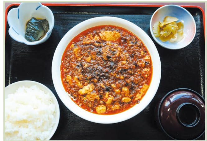
四川麻婆豆腐定食 Mapo tofu set meal 1,320円(税込)