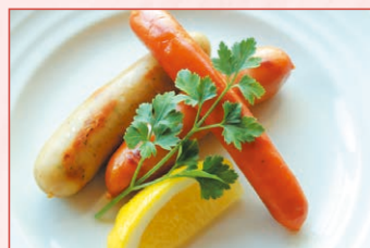
粗挽きソーセージ盛り合わせ (プレーン・ハーブ・チョリソー) Sausage platter 660円 (税込)