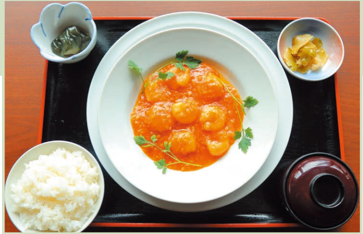
エビチリ定食 Shrimp chili set meal 1,540円(税込)