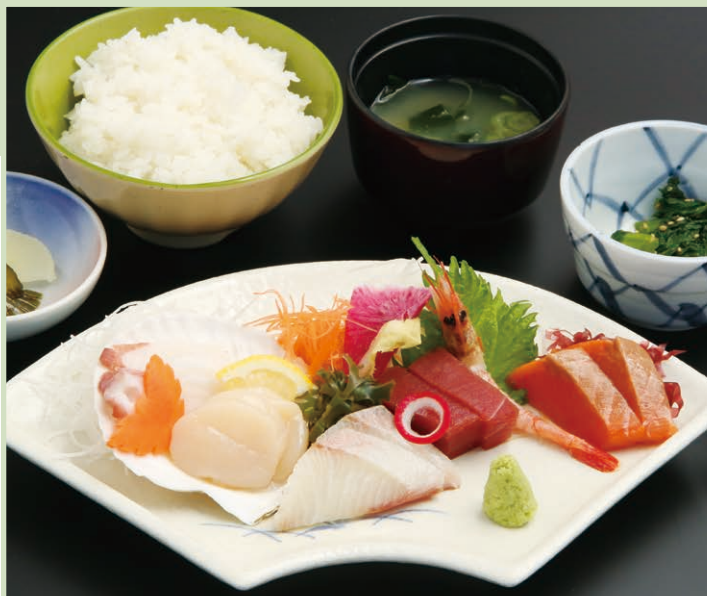
お刺身定食 Sashimi set meal 2,200円(税込)