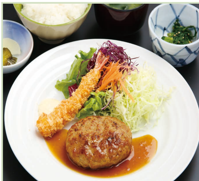
ハンバーグ海老フライ定食 Hamburger steak and fried shrimp set meal 1,540円(税込)