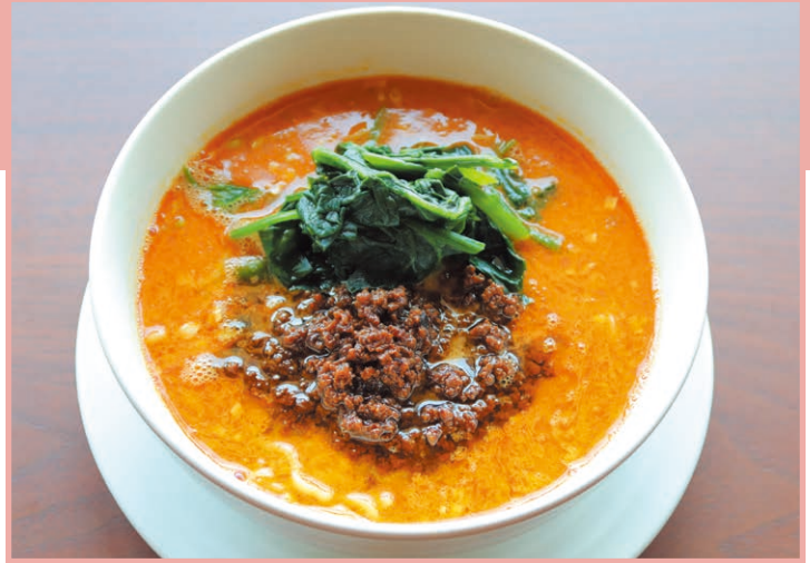
担々麺 Dandan noodles 990円(税込) (辛さ1~5まで選べます)