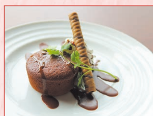
フォンダンショコラ Chocolate cake 550円 (税込)