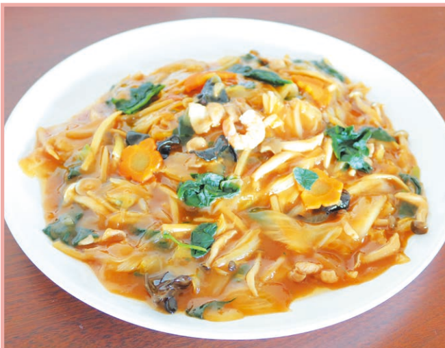
特製あんかけやきそば Pan-fried noodles with starchy sauce 1,100円(税込)